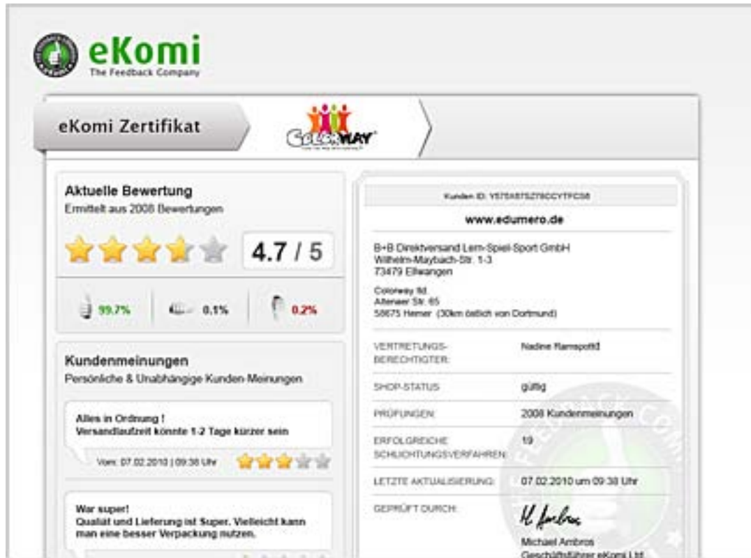
Figuur 3: certificaat pagina (overzicht van alle reviews)

Positieve reviews zijn de reviews met vier of vijf sterren, deze worden vrijgegeven nadat het eKomi team ze bekeken heeft. De reviews worden gepubliceerd op de certificaat pagina en op de widget.